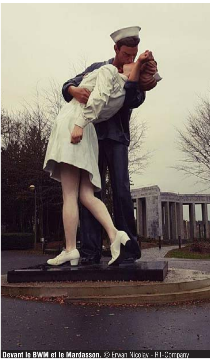
BELGA Devant le BWM et le Mardasson. © Erwan Nicolay - R1-Company

« Je n'ai pas choisi d'être embrassée. L'homme est simplement venu et m'a embrassée ou attrapée. »