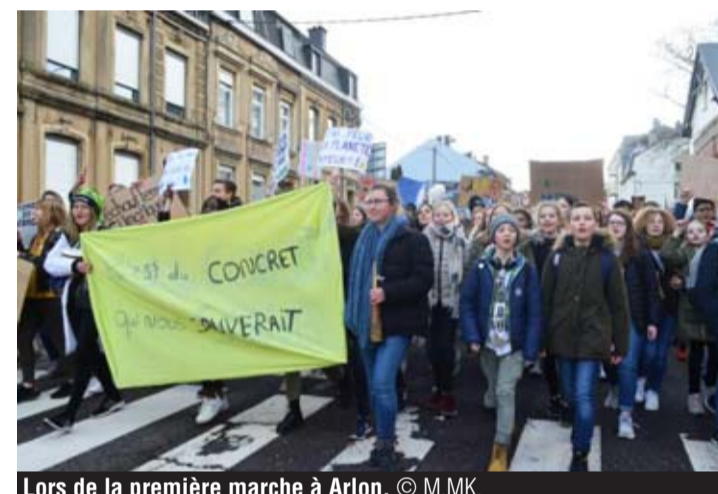
Lors de la première marche à Arlon. © M.MK.

Il y a quinze jours, une première marche pour le climat s'était déroulée à Arlon. Une marche organisée par des étudiants de l'INDA qui avait été un franc succès. Aussi, des étudiants d'Henallux ont décidé de remettre cela ce jeudi. Petite particularité: les marcheurs se promèneront dans les rues d'Arlon avec un sac poubelle - fourni par la Ville - à la main, histoire de joindre l'utile à l'agréable et de ramasser des déchets tout au long de leur parcours.